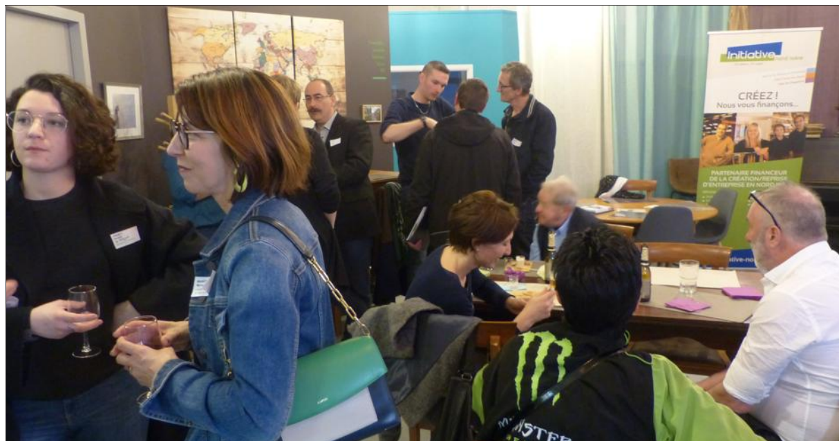
Les échanges entre entrepreneurs et bénévoles permettent de profiter de l'expérience de chacun.