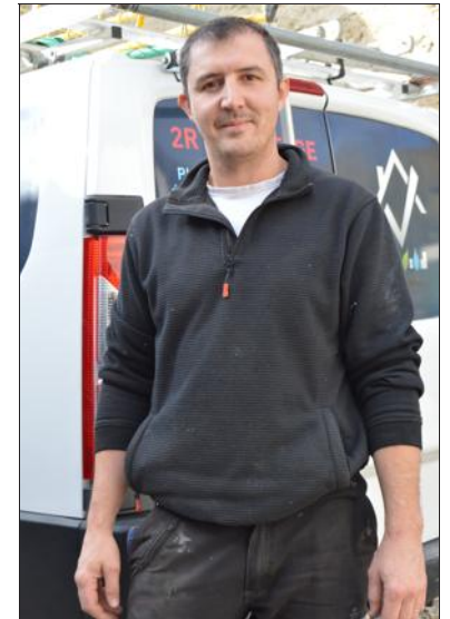
Raoul Raymond.