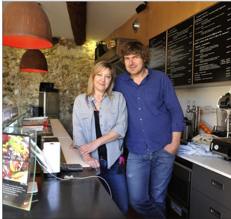
Les porteurs de projet peuvent faire appel à Initiative Nord Isère à différents moments : création, reprise, développement...

Pour obtenir un financement, l'entrepreneur devra ensuite défendre son