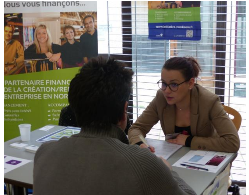
Un porteur de projet avec une chargée de mission lors d'un événement partenaire sur la création-reprise d'entreprise.