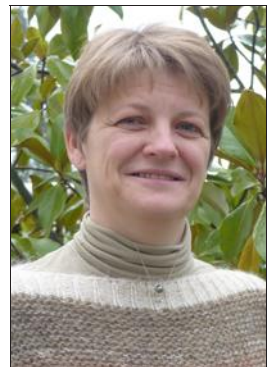
L'équipe d'Initiative Nord Isère est à l'écoute des entrepreneurs.

reçoit la décision, prise de façon collégiale, sous huitaine. 85% des projets reçoivent une réponse positive.