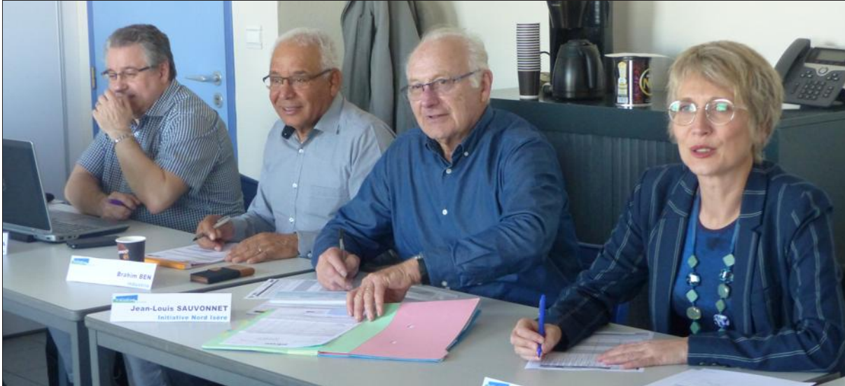
Le comité d'agrément se déroule forcément en présence du ou des porteurs de projet et de bénévoles professionnels implantés en Nord-Isère.

Constitué de bénévoles, le comité s'appuie sur l'expérience de ses membres pour évaluer au mieux la viabilité du projet présenté.